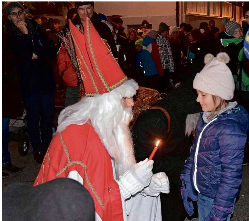
Auf dass es Licht werde: Der Samichlaus gibt sein Kerzenlicht weiter, kleine Gäste pausieren mitten im Adventsmarkt auf dem Bänkli, das die Linth-Tour mitgebracht hat, und die Jagdhornbläser am Speer sorgen für stimmungsvolle Klänge.

Die Marktstrasse «zmitzt im Dorf» bot Gelegenheit, zu schauen, zu kaufen, sich auszutauschen und miteinander auf ein hoffentlich gut zur Neige gehendes 2019 und aufs nahende 2020 anzustossen. Der Verein Goldingertal-Eschenbach richtete einmal mehr einen Markt aus, welcher eine grosse Vielfalt an Handwerkskunst und regionalen Produkten zeigte und sich auch aus kulinarischer Sicht nicht lumpen liess. Ob Gestensuppe, Pizza, Raclette oder Grillspieß – jeder kam zum Schmaus nach seinem Gusto. Auch warme Gaumenschmeichler der flüssigen Art gab es zuhauf. Insbesondere beim Krabmboli-Ausschank der Jagdgesellschaft Goldingen bildete sich eine lange Schlange und die Jäger füllten im Akkord die Becher mit den mundigen Seelenwärmern ab.